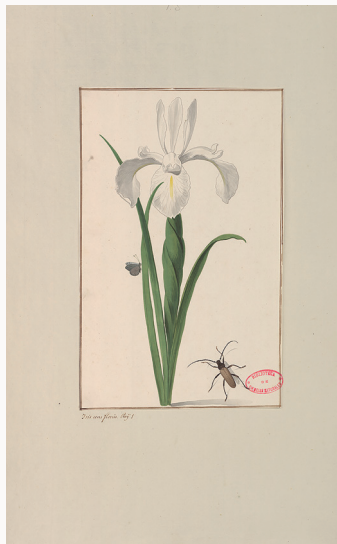
Alida Withoos (atribuido), Iris unifloris Roy 1.