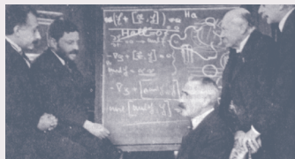
Einstein, Ehrenfest, Langewin, Kamerlingh-Onnes et Weiss, à Leyde en 1920.