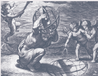
Opticorum libri sex philosophis juxta ac mathematicis utiles de Peter Paul Rubens, 1613.