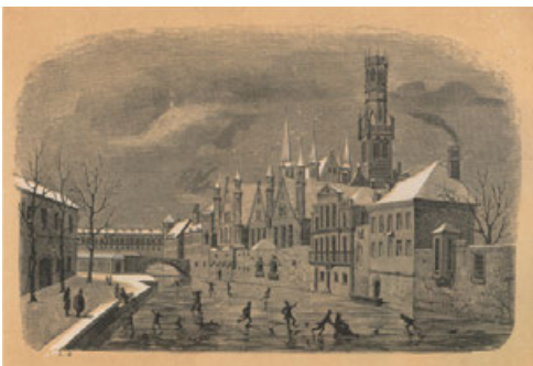
Iluminación asociada a fenómeno metereológico