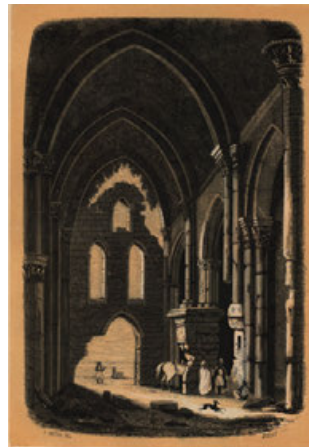
Luz focal sobre la escena