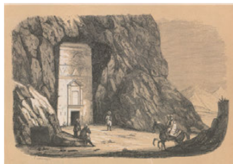
Fuerte golpe de luz sobre tema principal