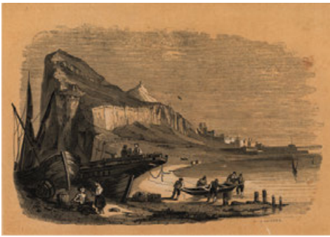
Luces que marcan recorrido y perspectiva

A continuación te mostramos algunas a las que hemos descrito en términos lumínicos. Intenta encontrar otras y descríbelas como se te ocurra.