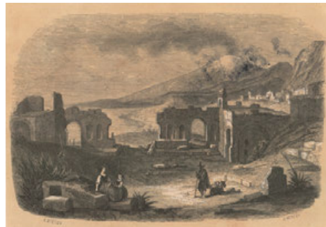
Luces salpicadas en puntos de interés