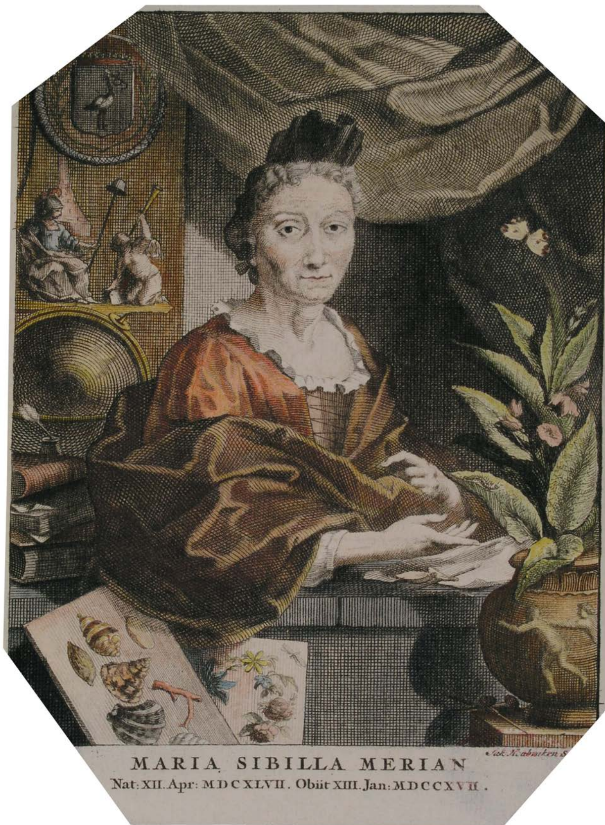
Georg Gsell (inv.) y Jacobus Houbraken (grab.), Retrato de Maria Sybilla Merian. Reproducción digital del original: estampa calcográfica iluminada, recortada. Archivo del Museo Nacional de Ciencias Naturales-CSIC. Fondo especial Colecciones iconográficas. Col. Van Berkhey, AC-N100C/002/01954.