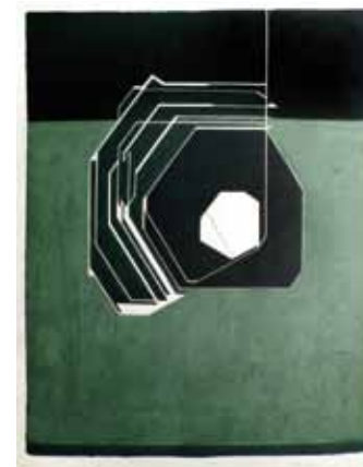
Barcelona , 1977