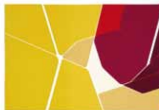
Gótica variante , 1974

Script II , 1970 Script I , 1970 Script III , 1970 Noirs , 1977 Bloom , 1990-93 De música I , 1978 De música , 1978 Affiche avant la lettre I 67 , 1978