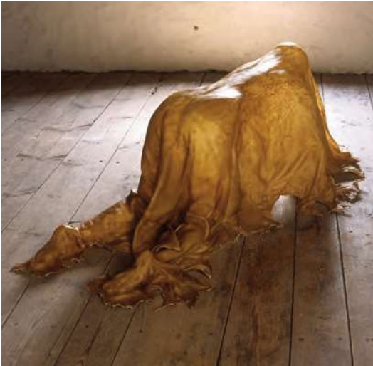
Imagen 1. Janine Antoni, Saddle (2000).

Cuero natural de ovino modelado en el cuerpo de la artista.