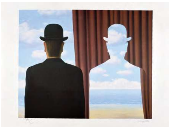
Imagen 1. René Magritte, Décalcomanie , 1966.

En esta obra aparecen una figura y una silueta con sombrero, una cortina marrón y nubes en el fondo. Es una obra que juega con la percepción y la realidad, elementos característicos del estilo de Magritte. Por lo general, sus obras desafían la percepción y la realidad. A menudo presentan objetos comunes en contextos inusuales o combinaciones inesperadas, desafiando al espectador a cuestionar lo que ven. Su estilo distintivo y su enfoque lo convierten en una figura destacada en la historia del arte del siglo XX.