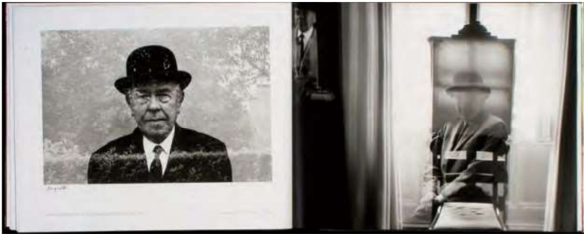
Imagen 2. Duane Michals, Las cosas son raras .1973.

Las cosas son raras es una serie de fotografías creada por el fotógrafo estadounidense Duane Michals en 1973. Esta serie es una exploración de la vida cotidiana y la percepción de la realidad. Cada imagen de la serie presenta una narrativa visual única que desafía las expectativas del espectador y juega con la idea de lo extraño y lo inusual en situaciones ordinarias. Michals es conocido por su estilo narrativo en la fotografía, y en esta serie en particular, emplea técnicas para crear una experiencia visual y conceptualmente rica.