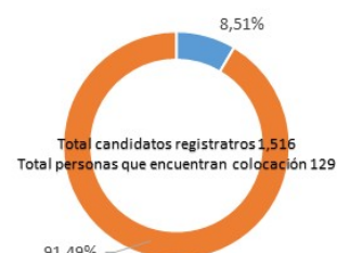
Porcentaje de colocaciones en relación a candidatos registrados en la Agencia

■ Personas colocadas ■ Personas candidatas