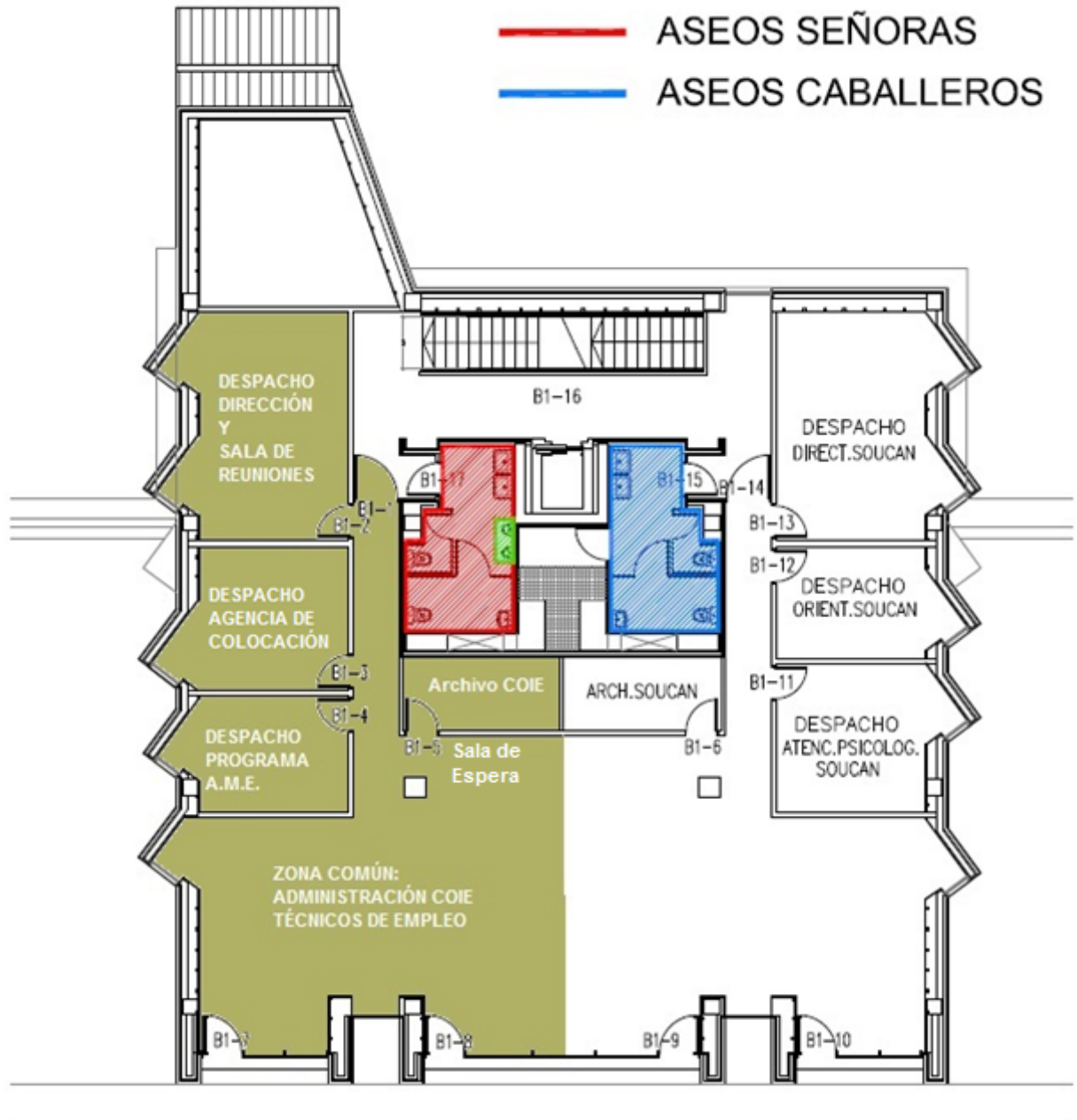
B TORRE B - PLANTA 1 COIE - SOUCAN