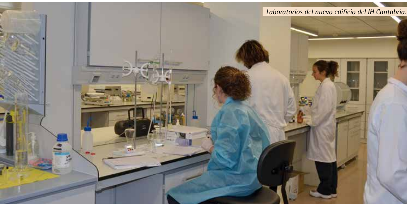
Laboratorios del nuevo edificio del IH Cantabria.

Adicionalmente, en el marco de Cantabria Campus Internacional se ha creado –mediante el programa Augusto González Linares (AGL) de atracción de talento internacional– un nuevo grupo de investigación en el campo de la ecohidráulica de estuarios que trabaja en el IH Cantabria y está conformado por un reputado investigador sénior, dos doctores y un becario predoctoral.