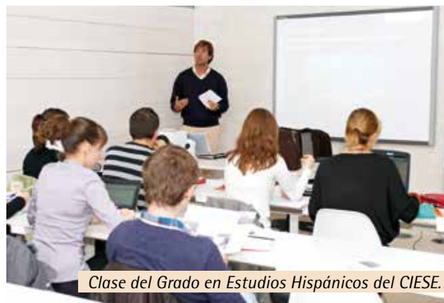
Clase del Grado en Estudios Hispánicos del CIESE.

UC y la Fundación Botín. Precisamente, con la Fundación Botín se ha dado un impulso a otras iniciativas como el desarrollo del Máster en Educación Emocional, Social y de la Creatividad o el Programa de Fortalecimiento de la Función Pública en América Latina.