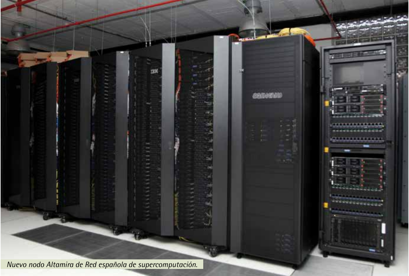
Nuevo nodo Altamira de Red española de supercomputación.

En el área estratégica de Física y Matemáticas hay que destacar la puesta en marcha en junio de 2012 del nuevo nodo de supercomputación Altamira, cuya renovación permite a la UC continuar siendo una referencia en la Red Española de Supercomputación y estar entre los cien centros de computación más importantes del mundo. Se encuentra entre los 500 ordenadores más potentes a nivel mundial, con el número 358, y está entre los 36 primeros en eficiencia energética. Cantabria Campus Internacional ha contribuido significativamente a la renovación de este equipo ubicado en el Instituto de Física de Cantabria (IFCA) al dedicar a su adquisición 1,1 millones de euros logrados en la convocatoria Innocampus 2010 del Gobierno de España. El nuevo nodo está ya a disposición de los investigadores, pero también para actividades de desarrollo e innovación con empresas a través del IFCA.