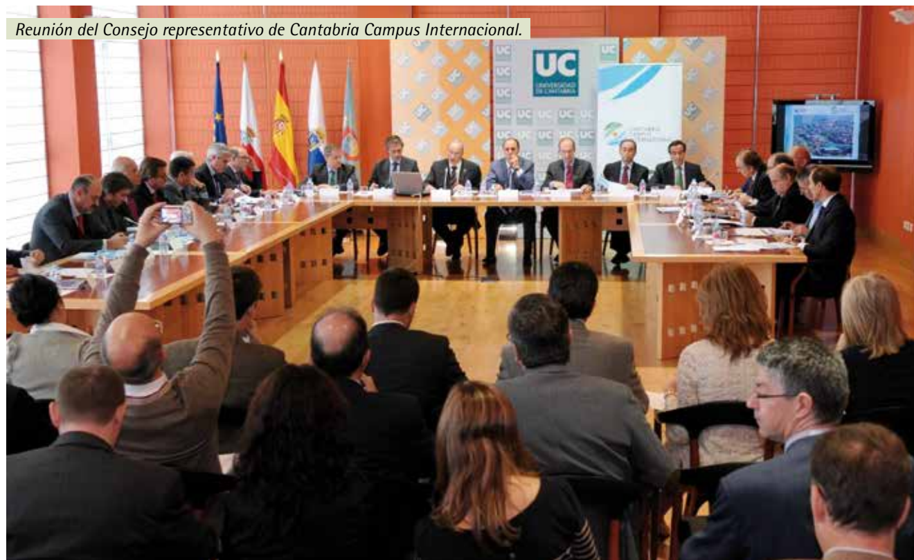
Reunión del Consejo representativo de Cantabria Campus Internacional.

Por todo ello, puede decirse que Cantabria Campus Internacional, el Campus de Excelencia Internacional de Cantabria, ha generado consenso entre los cántabros y sus representantes y es, según todos ellos manifiestan, un proyecto clave para el desarrollo regional.