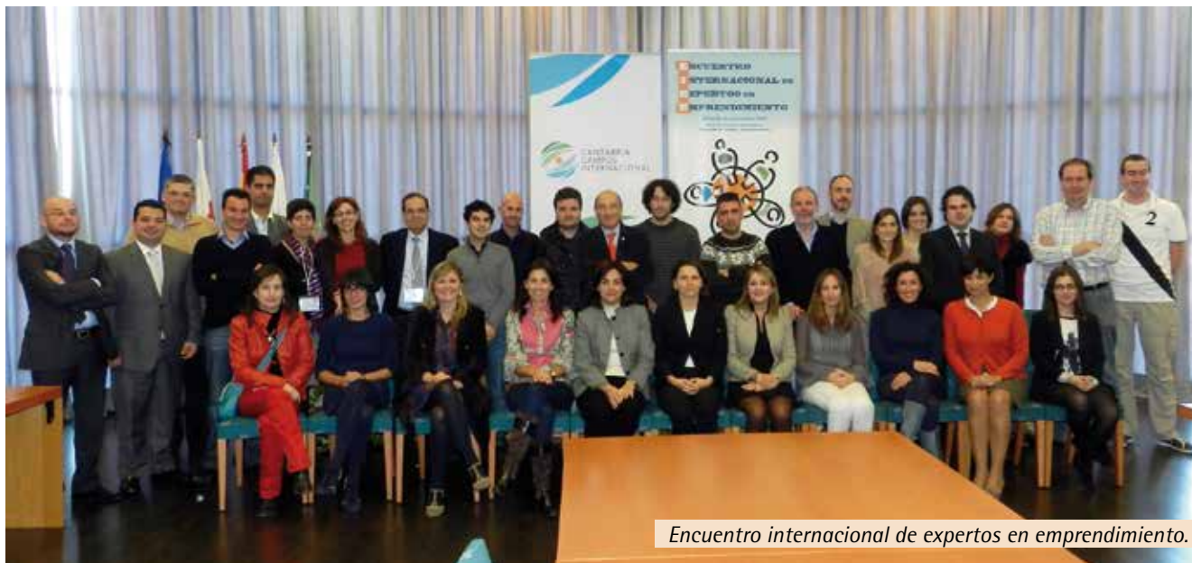
Encuentro internacional de expertos en emprendimiento.

El área estratégica de Patrimonio y Lengua ha avanzado en la consolidación del Centro Internacional de Estudios Superiores del Español (CIESE), centro adscrito a la UC según convenio firmado con la Fundación Comillas en 2010, mediante la puesta en marcha de la primera promoción del Grado en Estudios Hispánicos . Además, en este curso se ha trasladado a la sede de Comillas el Máster de Enseñanza del Español como Lengua Extranjera (ELE). Al CIESE también se ha incorporado mediante el programa Augusto González Linares (AGL) una investigadora de reputación internacional en los usos del español como lengua extranjera que además ha asumido las funciones de Dirección Académica de la institución. En colaboración con la Fundación Comillas también se ha participado en el Congreso Internacional del Español para Fines Específicos.