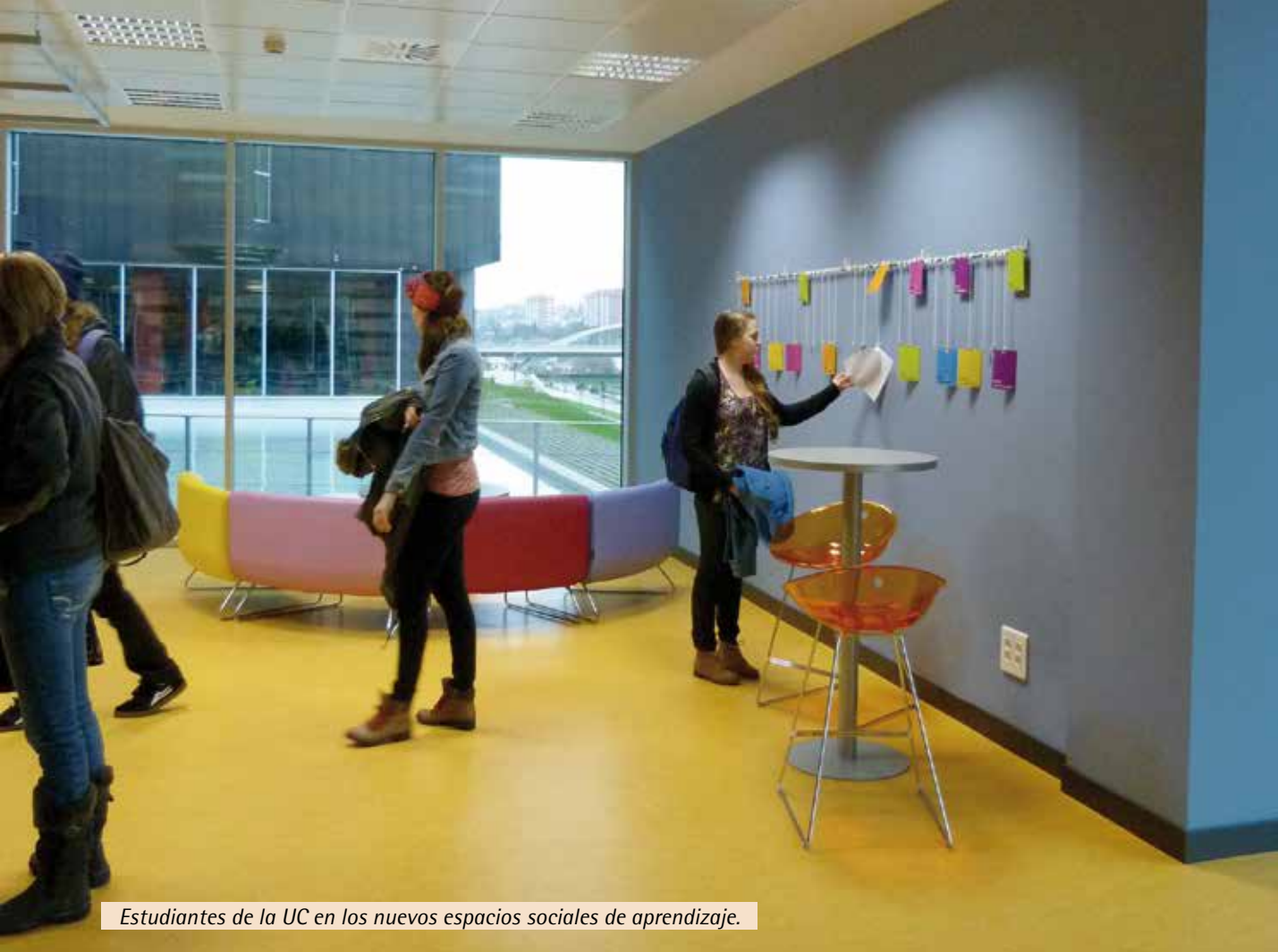
Estudiantes de la UC en los nuevos espacios sociales de aprendizaje.