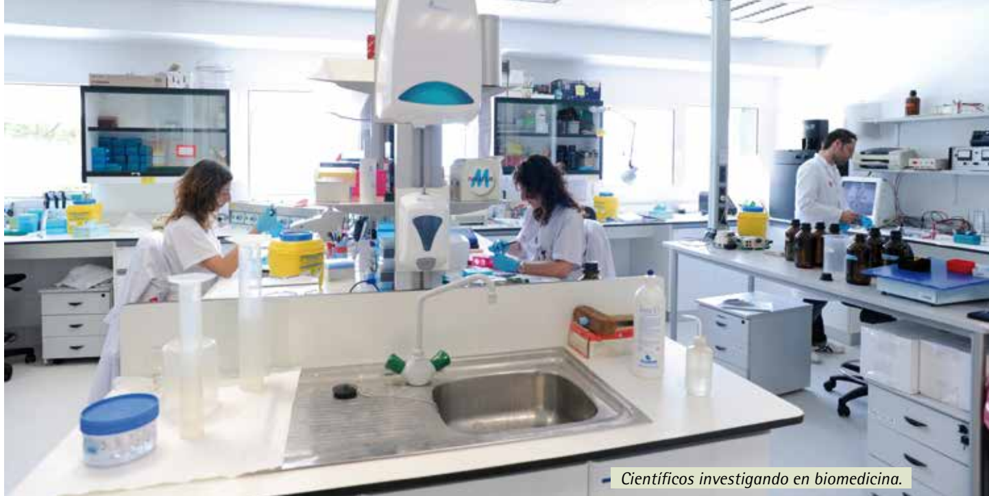
Científicos investigando en biomedicina.

El área estratégica de Biomedicina y Biotecnología ha logrado avanzar, sobre la base de lo establecido en el convenio de creación del "Órgano de Coordinación de la Investigación Biomédica de Cantabria", en un potente proceso de agregación institucional en torno a las ciencias de la salud, con la participación de la UC, el Hospital Universitario Marqués de Valdecilla (HUMV) y el Consejo Superior de Investigaciones Científicas (CSIC). En este sentido, cabe destacar los avances en el aprovechamiento conjunto de grandes equipos, el Foro de Investigación Biomédica de Cantabria, que está facilitando el intercambio de conocimientos entre los investigadores de la UC/IBBTEC y el HUMV/IFIMAV, y los avances en el proceso que hará posible la acreditación del IFIMAV como Instituto de investigación sanitaria ante el Instituto de Salud Carlos III. Asimismo, la UC ha firmado un convenio con el Hospital virtual Valdecilla para facilitar a este centro el uso del Servicio de Experimentación Estabulación Animal del Instituto de Biomedicina y Biotecnología de Cantabria (IBBTEC).