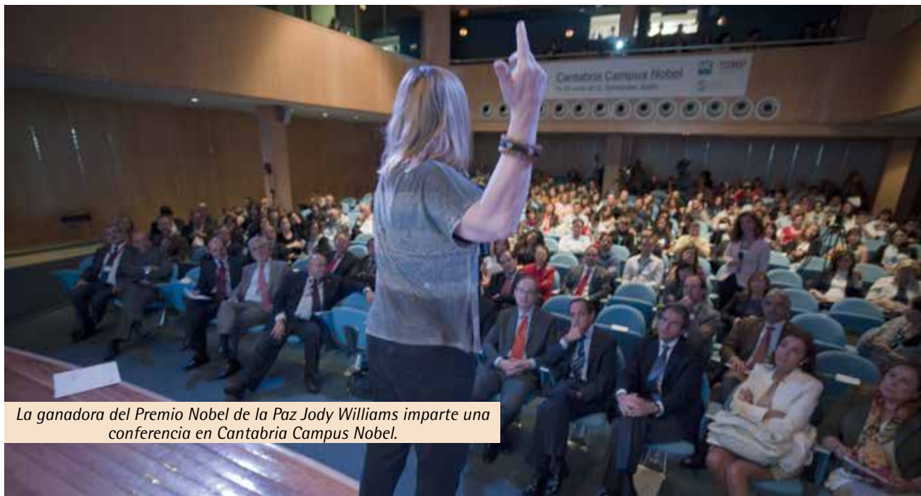
La ganadora del Premio Nobel de la Paz Jody Williams imparte una conferencia en Cantabria Campus Nobel.

La Oficina de Gestión Cantabria Campus Internacional cuenta con consultores en gestión de proyectos y comunicación que dan soporte multidisciplinar a la planificación, desarrollo y difusión de los proyectos en curso, realizan el seguimiento de las acciones estratégicas, así como la prospección de oportunidades de financiación. El equipo de gestión CCI desempeña su labor con doble enfoque: hacia adentro, en lo relativo a las medidas y acciones directamente vinculadas con la comunidad universitaria; y especialmente hacia afuera, como propiciador de las relaciones con el sector privado para la ejecución de determinados proyectos, fruto de la acción conjunta y la suma de competencias. La visión de la Oficina de Gestión CCI es hacer efectiva una de las principales funciones de la universidad: la de fomento de la excelencia, la internacionalización y la colaboración activa con todos los agentes e instituciones generadores de conocimiento como medio efectivo de desarrollo social.