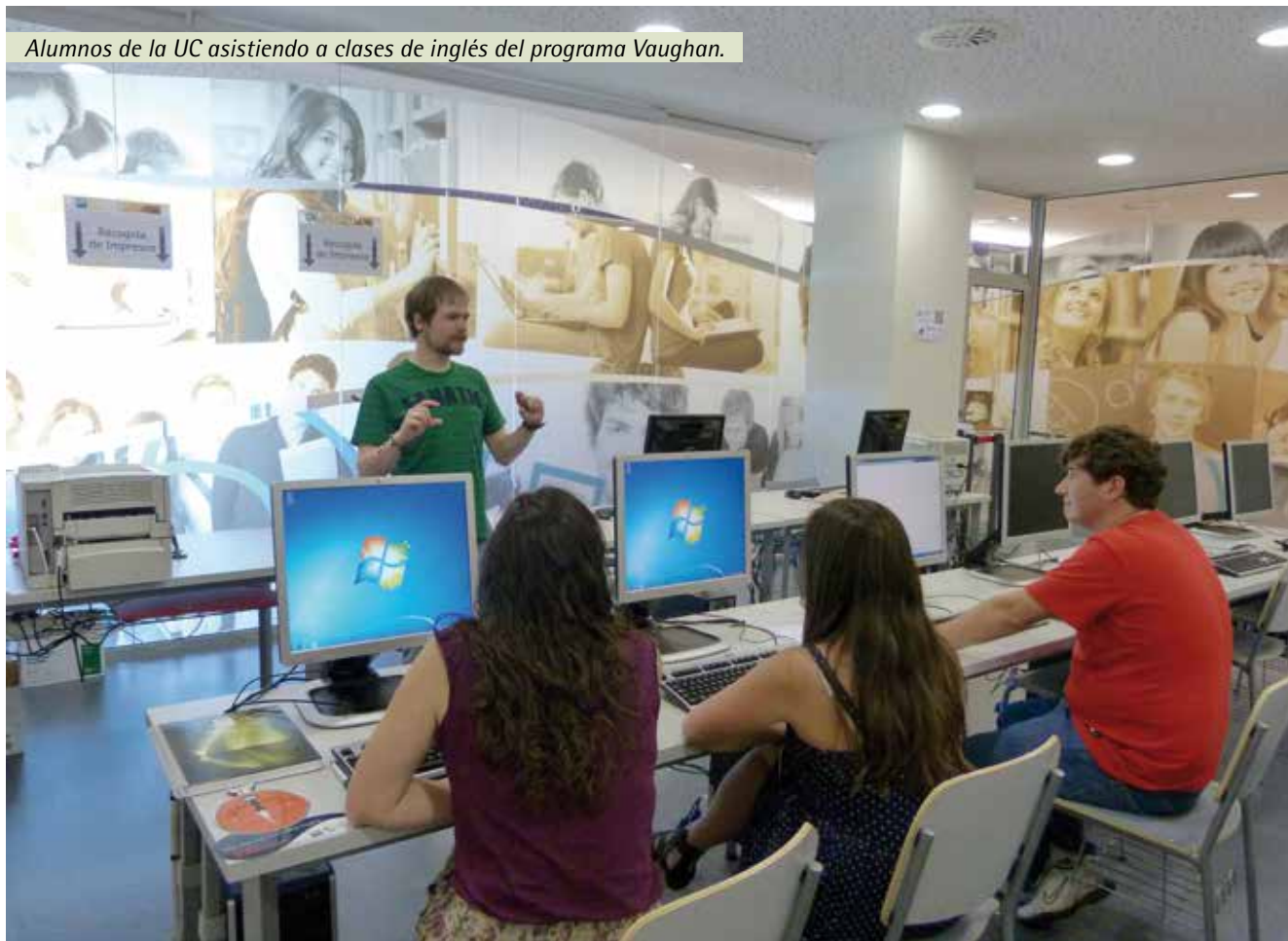
Alumnos de la UC asistiendo a clases de inglés del programa Vaughan.

En el ámbito de la mejora docente también es reseñable destacar los nuevos programas formativos puestos en marcha con socios del Campus de Excelencia, como la Fundación Botín o el Banco Santander. Estos programas se han mencionado previamente en esta memoria.