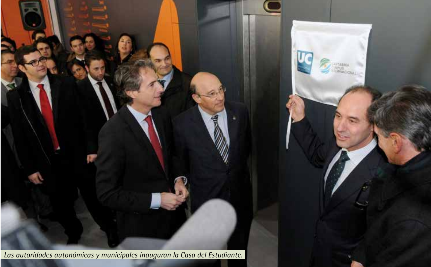
Las autoridades autonómicas y municipales inauguran la Casa del Estudiante.

En febrero de 2012 se inauguró la Casa del estudiante - Edificio Tres Torres, 6.000 metros cuadrados con espacios sociales de aprendizaje, que supuso una inversión de 8 millones de euros. Además, este curso se ha colocado la primera piedra de la residencia universitaria Juan de la Cosa, una inversión de 7,6 millones de euros con un plazo de ejecución de 20 meses.