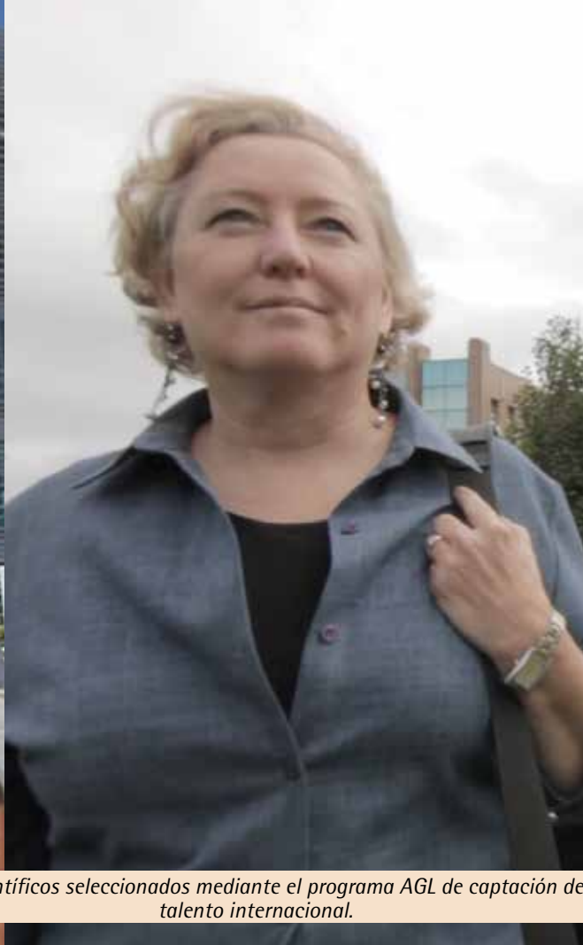
Dos científicos seleccionados mediante el programa AGL de captación de talento internacional.

la UIMP, como las Jornadas de innovación en el clúster portuario, celebradas en junio de 2012, o la organización de un nuevo "Curso iberoamericano de tecnología, operaciones y gestión ambiental en puertos," que se impartirá en otoño de 2012. Estas actuaciones se producen con la visión estratégica de una próxima creación del Centro Internacional de Tecnología y Administración Portuaria (CITAP) , que desarrollará actividades de docencia, investigación e innovación en el sector portuario.