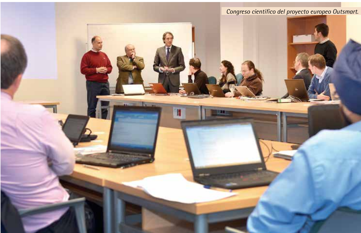
Congreso científico del proyecto europeo Outsmart.

Por otro lado, se sigue trabajando con el Ayuntamiento de Santander para la construcción del Santander Fire Research Center , un centro de investigación del fuego que será referente internacional.