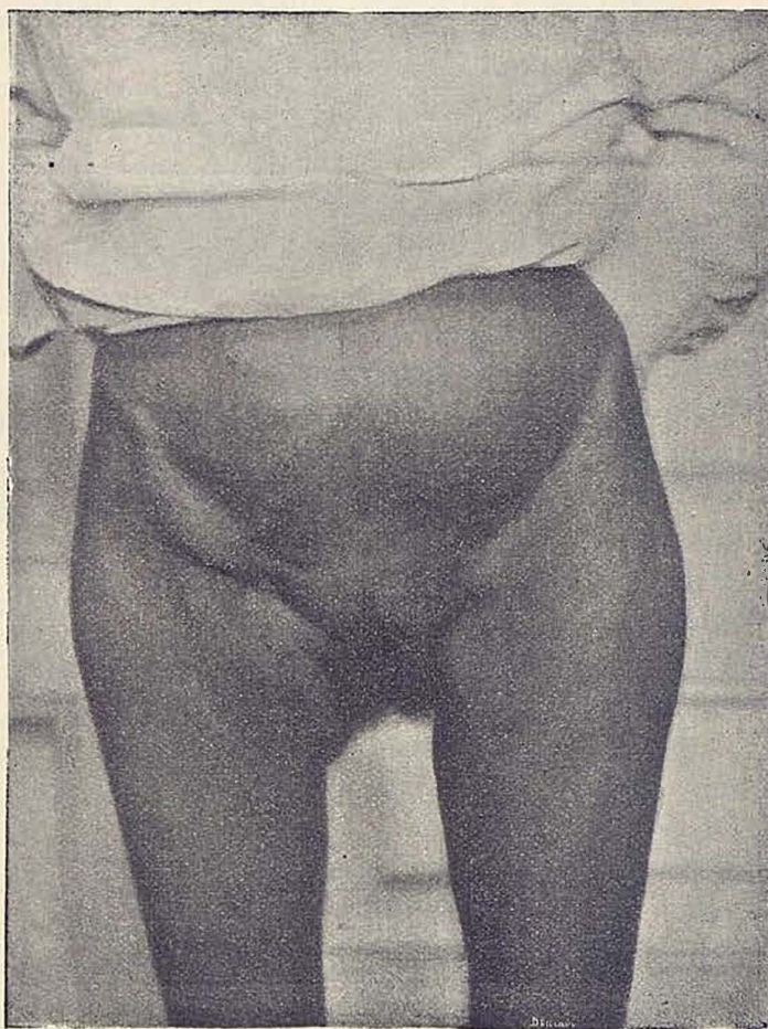
Figura 2. a

Es más que conveniente necesario dejar drenaje, pudiendo hacerse en la siguiente forma: una gasa penetra por el primitivo orificio, que ya la cucharilla se encargó de limpiar y otra entra á plomo por la herida operatoria. No se sutura la piel ó lo más un punto en cada comisura; en la pared muscular se dejan pasados unos tres puntos, que se dan con lazada y que pueden anu-