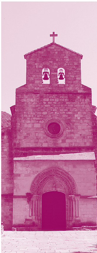
Iglesia de Santa María del Puerto de Santoña.

Aula de Patrimonio Cultural . P. encuentro: iglesia