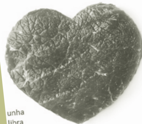
unha libra de carne