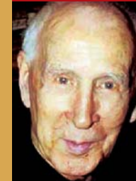
Henri de Lubac 1896-1991