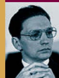
Wolfhart Pannenberg 1928