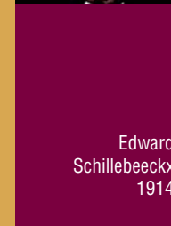
Edward Schillebeeckx 1914