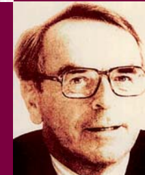
Jürgen Moltmann 1926